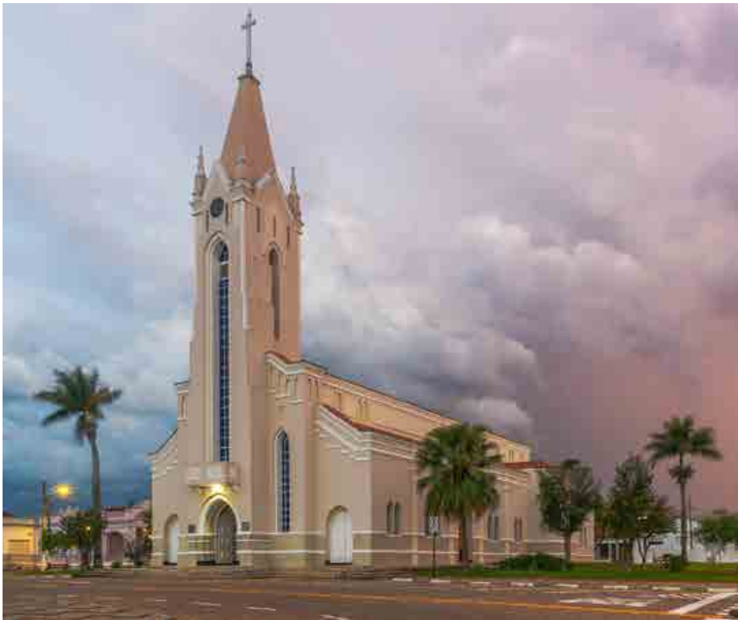
Luzes e ângulos distintos da bela Igreja Matriz.