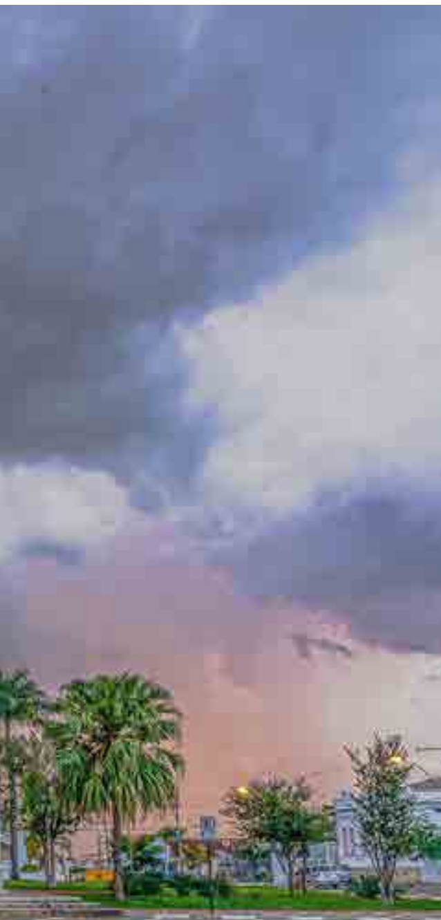
Igreja Matriz na luz de verão de uma tarde de chuva.