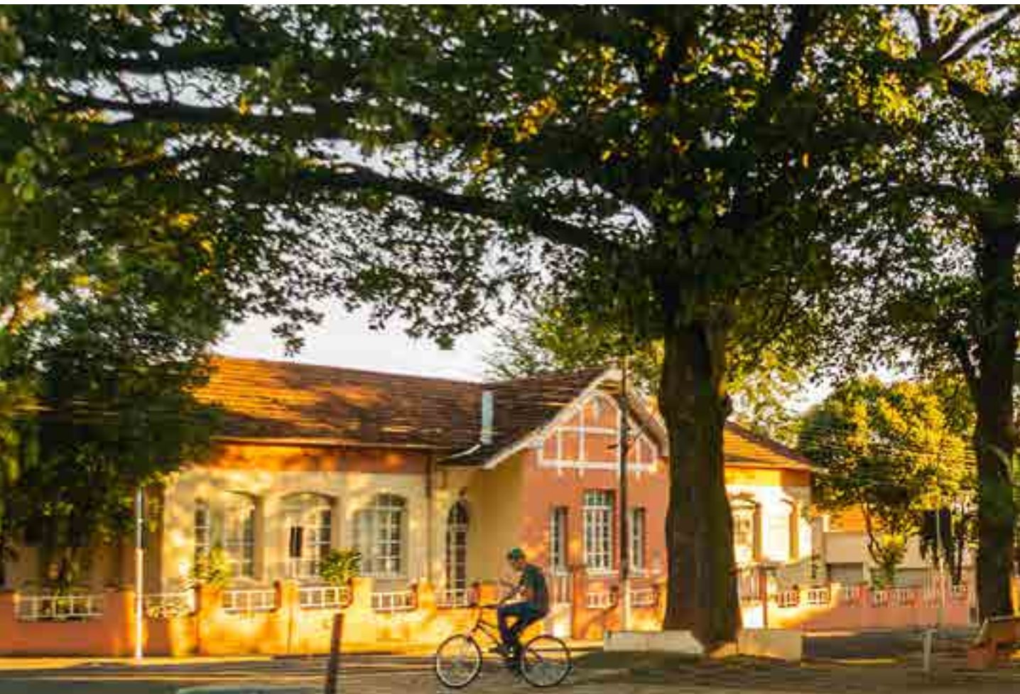
A Escola Honorato Borges em dois momentos.